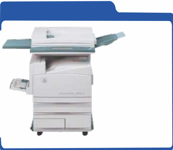
Apartir de 20 Impresiones Unicamente