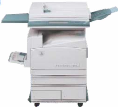
Apartir de 20 Impresiones Unicamente